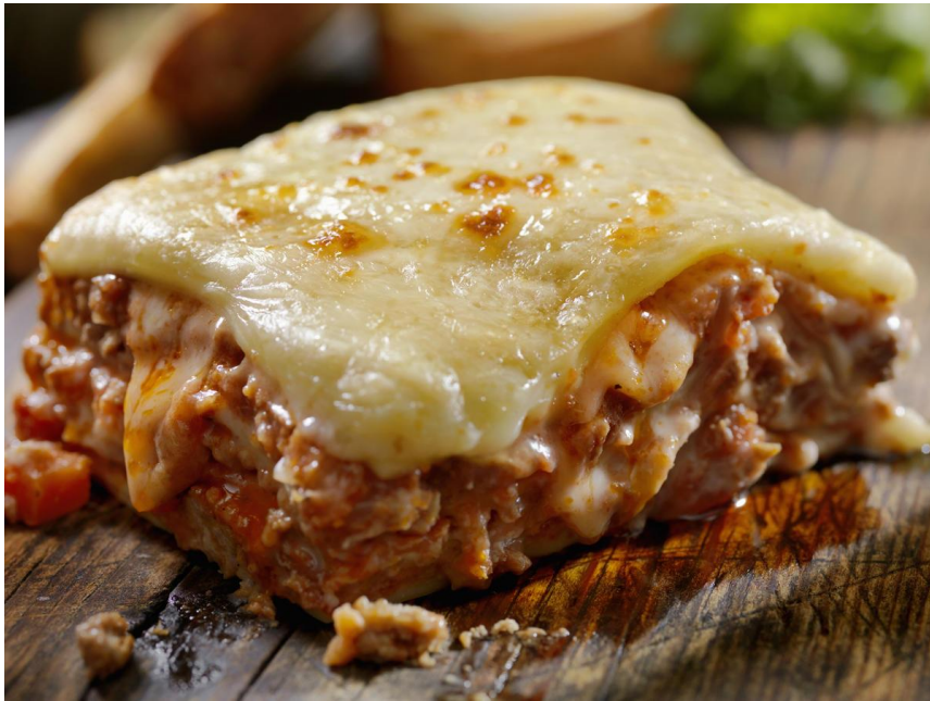
cheese and sauce