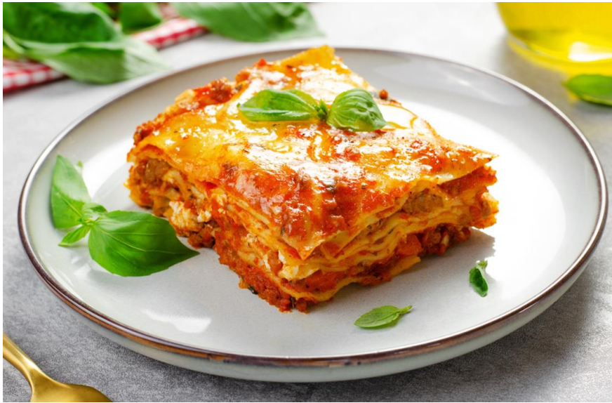
Vegetarian lasagna. with tasty vegetables, crispy gratinated with cheese and sauce